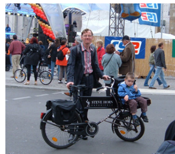
FOTO: MUSIKER NACH DER VERANSTALTUNG AUF DER JUBELMEILE